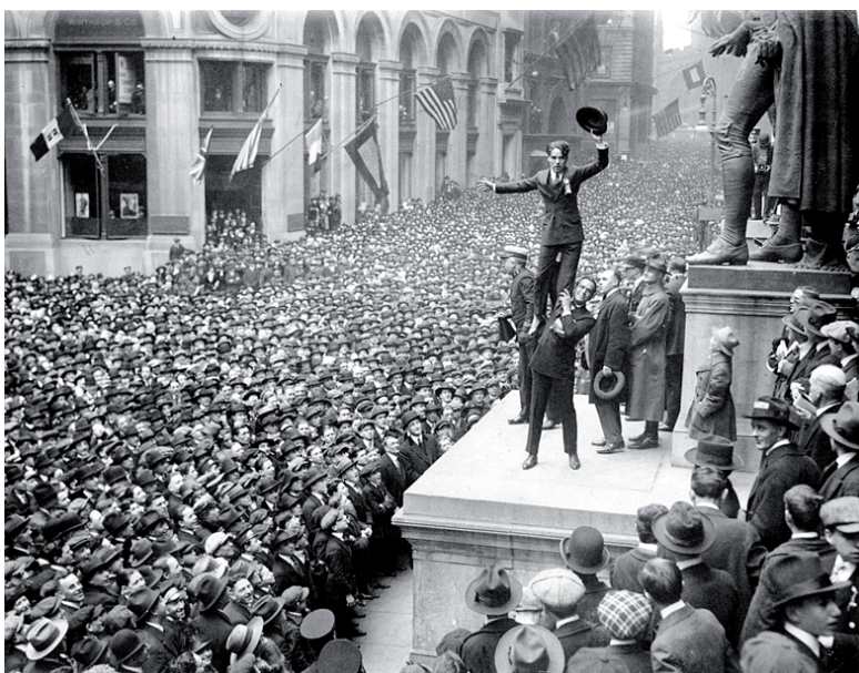
Charlie Chaplin stands on Douglas Fairbanks' shoulders during a rally at Wall Street in 1918.

littéralement, les activités bancaires de l'ombre. Certains acteurs financiers, affranchis de toute réglementation bancaire, se sont au fil du temps octroyé la possibilité de faire comme les banques : transformer des dépôts de court terme (votre argent à la banque) en des crédits de long terme, en s'endettant. Qui est capable de contrôler le niveau de cet endettement, la nature de leurs activités, ou de vérifier si leurs bilans peuvent supporter ces risques ? En 2007, le « shadow banking », puissant facteur d'aggravation de la